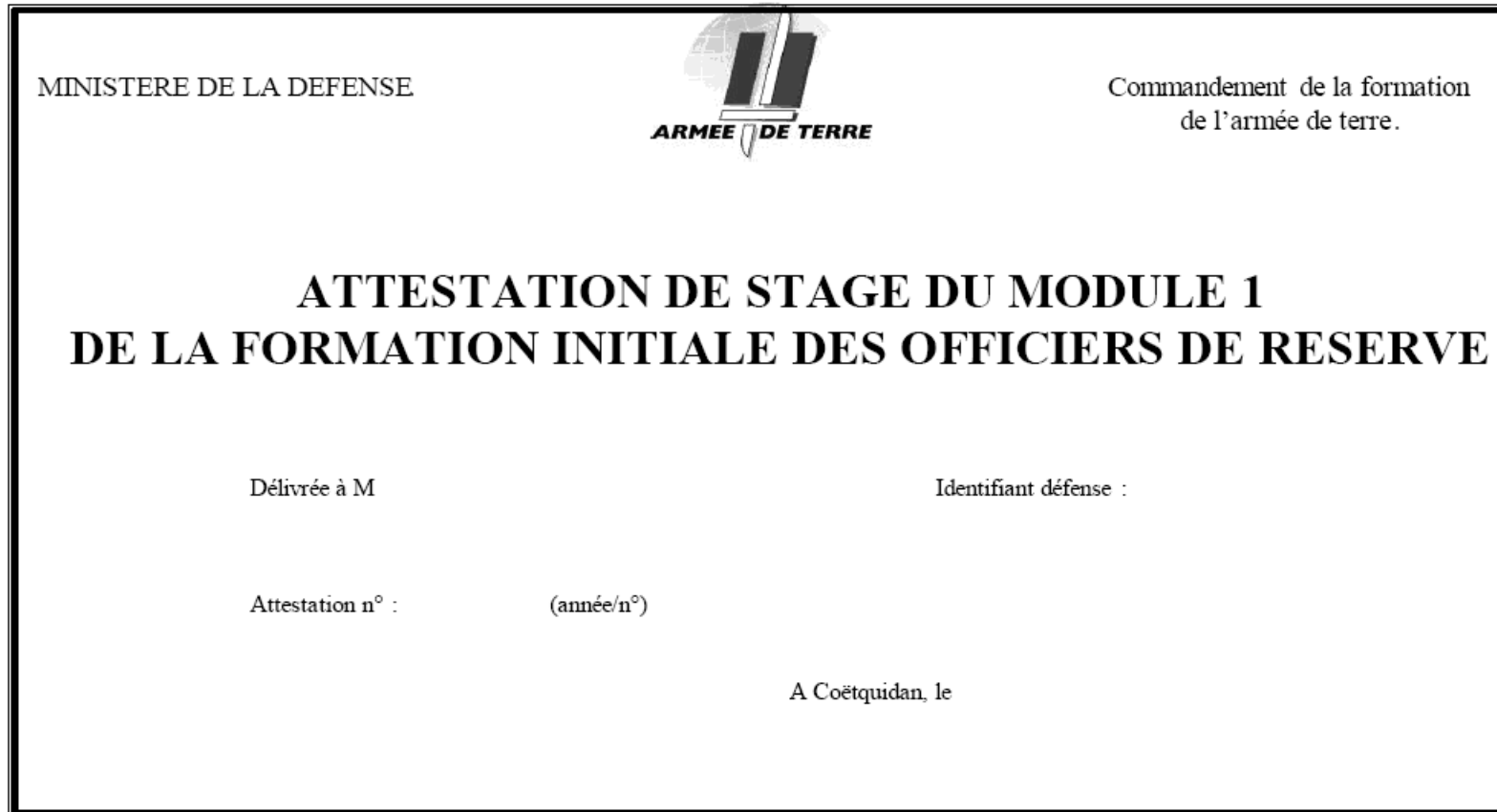
Figure 1. Attestation de stage du module 1 de la formation initiale des officiers de réserve.